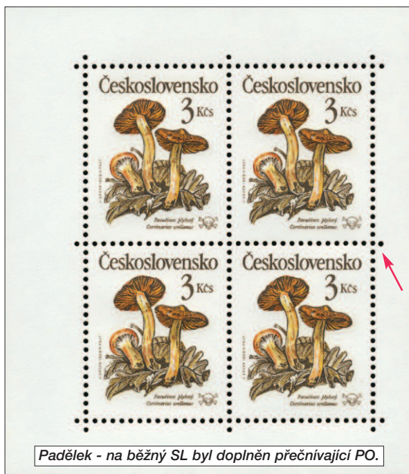
Padělek - na běžný SL byl doplněn přečnivající PO.