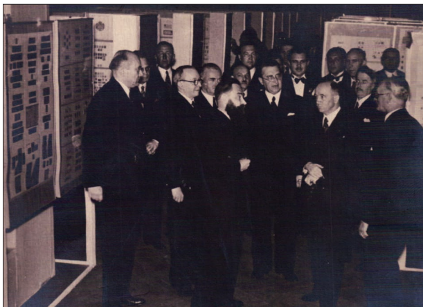
RG na výstavě provádí prezidenta republiky E. Beneše.

Bratislavské výstavy se samozřejmě osobně zúčastnil, jako mnoha jiných, jak dosvědčují pohlednice, které dotud posílal. Z výstavy Praga 1938 si schoval volnou vstupenku a na dopisnici příteli na Slovensko píše: „Jsem celý den na výstavě na roztrhání. Právě sedím na kongresu Federace.“