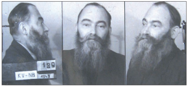
Připojené fotografie jsou nepochybně policejního původu, což zjevně souvisí se zlovybným závěrem na deskách spisu: „Okresní čtyřka doporučuje TNP“.

Jiné poznámky a názory o prověřované osobě: Jmenovaný jest nebezpečným nepřitelem dnešního zřízení a státu, jest považován za odborníka ve svém oboru, pracuje přto, že mu to vynáší značné zisky, jest propagátorem západního rozhlasu a šeptané propagandy. Jeho manželka jest téhož ražení.