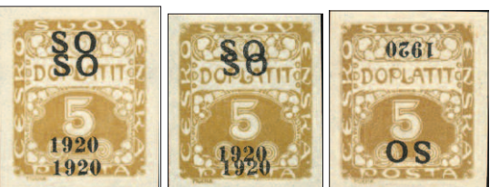
Známky s padělaným dvojitým přetiskem a známka s padělaným přetiskem převráceným – ve skutečnosti tyto varianty jako pravé nebyly dosud předloženy.

Podrobněji se otázce tisku těchto padělků budeme věnovat v závěru našeho seriálu, kde si rovněž ukážeme společné znaky s padělky dalších emisí, pocházejícími ze stejného zdroje. Už dnes jsme si však na obrázcích představili některé z dosud známých exemplářů padělků tohoto přetisku (všechny pocházejí ze stejného štočku), aby se proti nim mohli účinně bránit sami sběratelé. ■