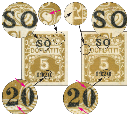
Dvojice známek s padělanými černými přetisky se stejnými drobnými DV (napodobené ZP 39); samy známky přitom pocházejí z odlišných ZP (37 a 64).

Obě zkoumané známky jsem silně zvětšil a prohlédl jejich přetisky. Ukázalo se, že způsob otištění barvy i barva sama se liší od známek zaručeně pravých, a to jak při pohledu shora, tak v průhledu. Ve světle těchto skutečností bylo možno prohlásit, že jde o padělky ke škodě sběratelů. Dodejme, že zhotoveny byly zřejmě ofotografováním přetisku z pole 39/A2 (možná nahodile vybraného, ale možná vybraného úmyslně, protože obsahuje několik drobných charakteristických vad – což na první pohled samozřejmě působí důvěryhodně). 3)