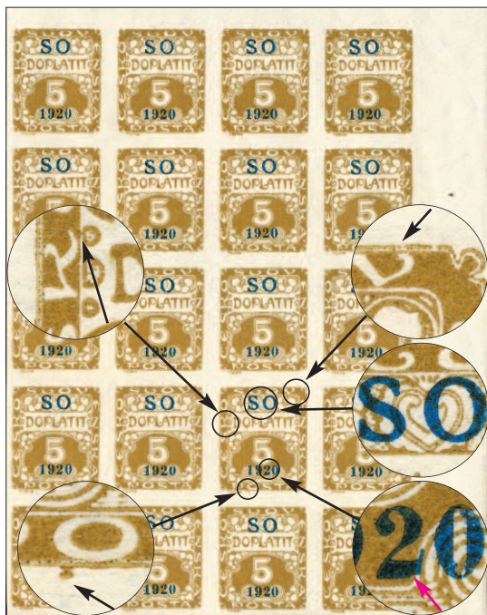
Identifikační 20blok známky 5 h s pravým modrým přetiskem z TD A/2, na jehož ZP 39 se nachází přetisk s charakteristickými drobnými vadami, který posloužil padělatelům ke zhotovení falešného štočku.