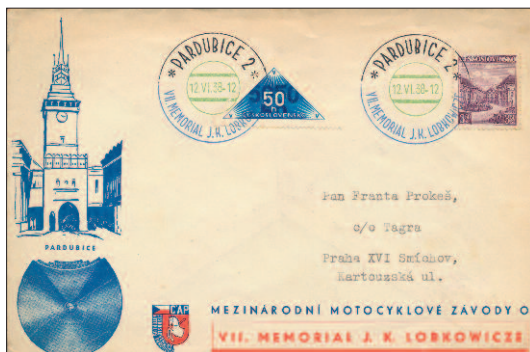
Nahoře standardní otisk, dole otisk s nesprávným rokem.

Samostatnou kapitolou jsou překvapivě datové údaje na pamětních razítkách, která v katalogu protektorátu obsažena nejsou – i když sem podle můstku spadají. Příkladem je otisk razítka Pardubice 2 / VII. memorial J. K. Lobkowicze s datem 12. VI. 1939. Samo razítko je nepochybně československé a používáno bylo 11. a 12. června 1938. Že by se o rok později konal stejný (VII.) ročník a použito bylo stejné tříbarevné razítko, jen se změněným rokem? Na to nám odpoví historie tohoto ve své době slavného motocyklového závodu. Pořádaný byl od roku 1932, na počest českého závodníka Jiřího Kristiána Lobkowicze (+ 25), který téhož roku zahynul při automobilovém závodě v Berlíně. V roce 1939 se memoriál měl jet 3. září, okupační úřady jej ale nepovolily. Další ročník byl připraven až v roce 1947, ale ani ten nakonec neproběhl, tentokrát pro špatné počasí. Vyobrazený otisk s vročením 1939 tedy ve skutečnosti není protektorátní, ale jde o nesprávně nastavený údaj v roce 1938. Na chybu se zřejmě nepřišlo hned (i když později byla popsána), protože se takové otisky vyskytují poměrně často – a mohly by sběratele protektorátních razítek splést.