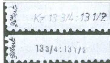
Nahoře padělek, dole pravá známka.

Na zadní straně je známka opatřena padělanou značkou znaleckou značkou Gilbert, umístěnou ve správné poloze. Jde o padělek znač-