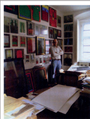
ATELIÉR / STUDIO, VELVARY, 30. 8. 2006