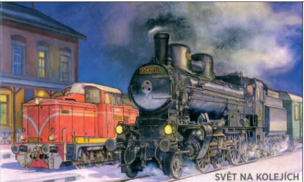
SVĚT NA KOLEJÍCH

Mezi parními lokomotivami se vždy těšily hlavní pozornosti rychlíkové stroje, které byly chloubou jednotlivých železničních správ. Stranou zájmu veřejnosti proto často zůstávají lokomotivy, které dobře a věrně sloužily železniční dopravě po mnoho desetiletí. Mezi tyto hrdinky vřadních dní patřily i lokomotivy původní rakouské řady 429 kS18, kterých bylo v letech 1909-1917 postaveno ve třech sériích 380 kusů. Autorem lokomotiv je Karl Göblsdorf, nejvýznamnější rakouský lokomotivní konstruktér. ČSD převzaly po I. světové válce celkem 152 lokomotiv a označily je řadou 354.7. Během let prošly částečnými rekonstrukcemi a z osobní dopravy byly vyřazovány po více než půlstoletí služby, poslední v roce 1970. Jedinou zachovalou lokomotivu je 354.7152, která byla postavena roku 1917 v První českomoravské továrně na stroje v Praze (později CKD). V roce 2017 lokomotiva slaví 100. narozeniny a díky starostlivosti členů Klubu historie kolejové dopravy Praha je v plně provozuschopném stavu.