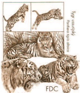
ZOO Hodonín Tygr ussurijský