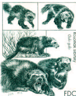
ZOO Brno Rosomák sibiřský