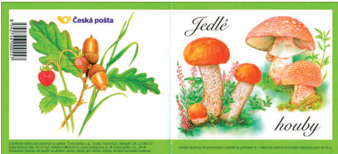
Známkové sešitky lze objednat na adrese: Česká pošta, s.p., Služby filatelistů, Nákladní 29, CZ-366 07 Dřevo Kahovky Vary 70; e-mail: filatelie@vklpost.cz; www.ceskaposta.cz; Písmenové známky lze použít na jakékoli zásilky, stejně jako běžné známky shodné nominální hodnoty.