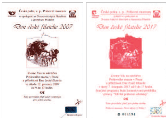
Historicky první a poslední pozvánka – PPM 1 a 22.