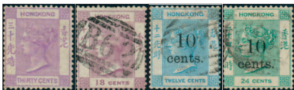
S Č Č/S Č/Č

Na známkách je nominální hodnota uvedena slovy (S), nebo číslem (Č). Hodnota změněná přetiskem je uvedena číslem, hodnota původní známky může být uvedena slovy (Č/S), nebo rovněž číslem (Č/Č).