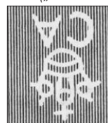
dtto a „vzhůru nohama“