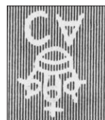
převrácená („vzhůru nohama“)