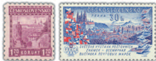
Pohled z Prahy na Strahov a ze Strahova na Prahu.