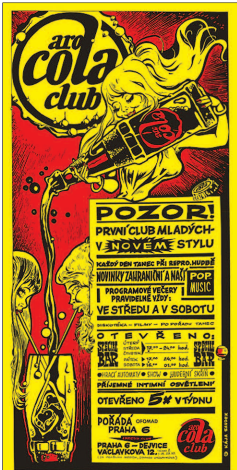
Kájův plakát, který je dnes už vzácným sběratelským kouskem.

Tedy jsem se s bratry Saudkovými těsně minul – oba totiž na přelomu šedesátých a sedmdesátých let měli leccos společného s Arocolaclubem ve Václavkově ulici v pražských Dejvicích. Kája pro něj vytvořil plakát a Jan vyzdobil jeho stěny obrazy.