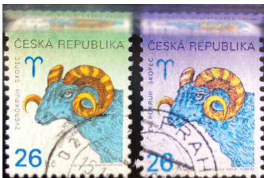
Pravá známka a padělek ke škodě pošty (pod UV lampou).

Vznikl tak neobvyklý padělek, který napřed poškodil poštu, a pak sběratele. FB