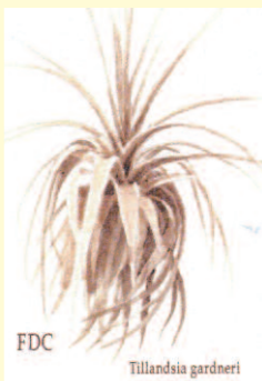
FDC Tillandsia gardneri