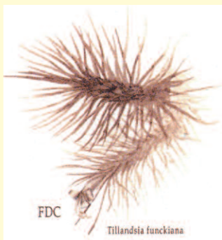
FDC Tillandsia funkiana