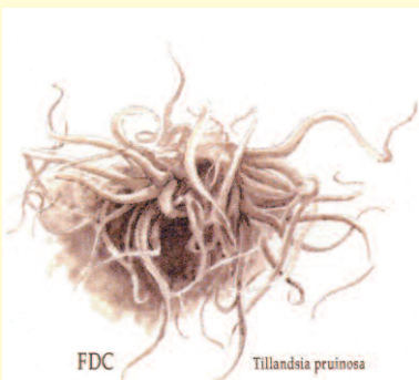
FDC Tillandsia pruinosa